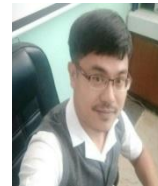
(ภก.มนตรี วงศ์คำมา) หัวหน้ากลุ่มงานเภสัชกรรมฯ ต่อ ๑๑๒๕